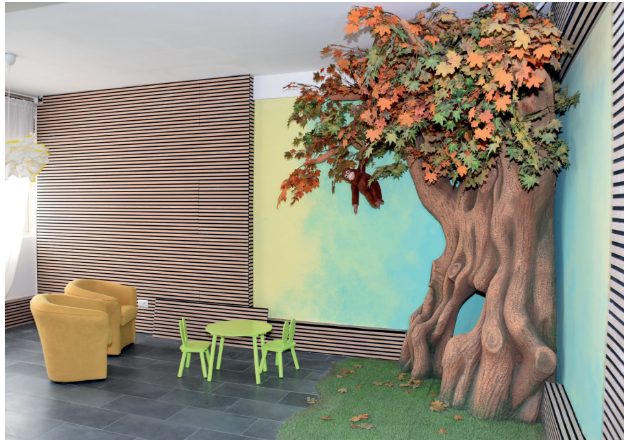
La stanza del Commissariato di Tivoli Roma

Nel quadro delle strategie dedicate alle vittime in condizioni di vulnerabilità, fondamentale è la prevenzione dei fattori di vittimizzazione secondaria , su cui il Dipartimento della Pubblica Sicurezza è da sempre attento, tanto che già nel 1988 si raccomandava alle Questure che venissero dedicate équipes di personale qualificato e locali riservati per accogliere e ricevere le denunce delle vittime di violenza sessuale, al fine di prevenire ulteriori disagi.