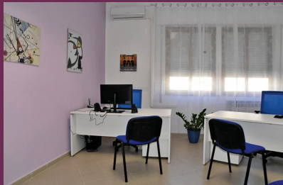
La stanza della Questura di Caltanissetta