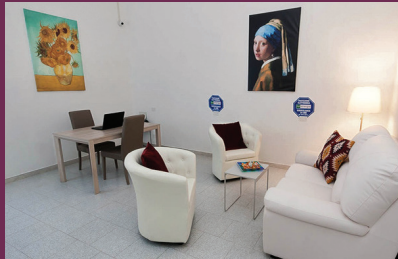
La stanza della Questura di Cremona